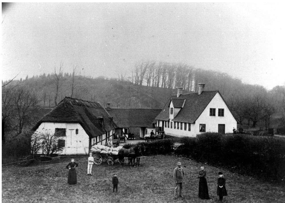
Øverste Ørkild Mølle, ca. 1915, set fra nordøst. Længen til venstre er i dag nedrevet, de øvrige bygninger er bevaret (Svendborg Byhistoriske Arkiv).

Vel har komplekset mistet værdi i kraft af de elementer, der er taget ud af drift, nedrevet og fjernet, men møllen ligger, hvor den har ligget siden middelalderen og fortæller en væsentlig historie om Svendborg, og den opgave er Øverste Ørkilds mølle i dag omtrent ene om. Omkring år 1900 havde Svendborg stadig 6 vandmøller: Bymøllen, Pjentemøllen, Grubbemølle, Ravnemølle, samt Øverste og Nederste Ørkilds vandmøller. Siden nedrivningen af Grubbemøllen i 2003 har der kun været et sammenhængende vandmølleanlæg tilbage, nemlig Øverste Ørkilds vandmølle, der med sin vand-opstemning, møllehus, beboelse og økonomibygninger trods alt udgjorde en helhed, der kunne fortælle historien.