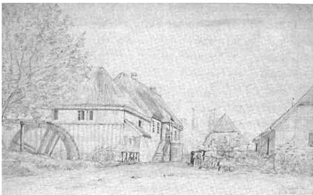
Tegning af Ørkild Øverste Mølle set fra sydvest, 1846. (Svendborg Købstads historie bd. 2 s. 753)

De tre sammenbyggede udlænger, til dels i bindingsværk, vurderes at have en samlet bevaringsværdi på 6, idet det her bemærkes, at deres kulturhistoriske værdi tilsyneladende ikke er vurderet og talt med i vægningen. Udlængernes miljømæssige værdi vurderes til 4.